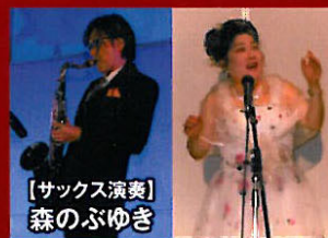
【サックス演奏】 森のふゆぎ

総合芸術であると同時に宗教的な 行為でもあるハワイの伝統的な歌 舞音曲「フラ」。フラにはダンス、演 奏、詠唱、歌唱の全てが含まれてい ます美しく幻想的な「フラ」の魅力 をご堪能ください。