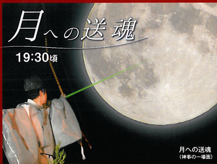
月への送魂 (神事の一場面)

満ち欠けにより死と再生を繰り返す月は“人間の象徴” “月”つまり天国へ魂を送る儀式…それが「月への送魂」